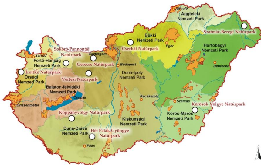
1. ábra - A természetvédelemért felelős miniszter által elismert magyarországi natúrparkok területi elhelyezkedése (2015. augusztus 31.) és kapcsolatuk a hazai nemzeti parkokkal és a nemzetipark-igazgatóságok működési területével

Egy település, Tatabánya két natúrpark kezdeményezéshez (Vértesi Natúrpark és Gerecse Natúrpark) is csatlakozott, ezért valójában a natúrparki települések száma országosan összesen 211.